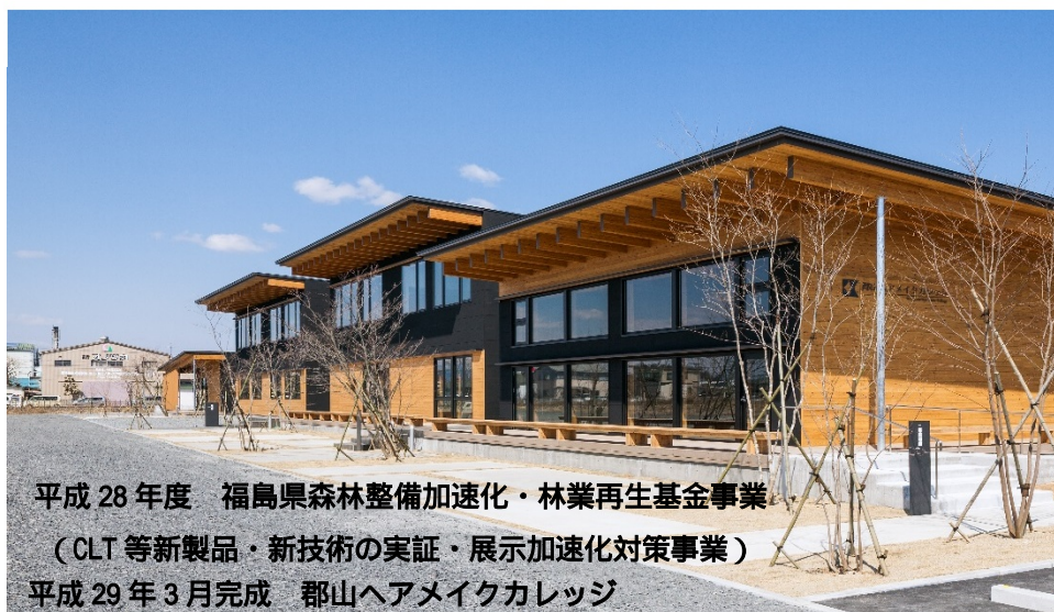
平成 28 年度 福島県森林整備加速化・林業再生基金事業 (CLT 等新製品・新技術の実証・展示加速化対策事業) 平成 29 年 3 月完成 郡山ヘアメイクカレッジ

近年、豊かな森林資源を活かした地域経済の活性化・地域再生等への関心が高まっています。木材の良さや新たな可能性について考えていただくため、林業復活に向けた取組みや、先進的な木造建築等の事例について、ご紹介します。