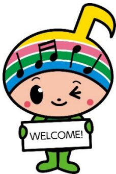
郡山市イメージ キャラクター がくとくん

【宿泊費】インターンシップ中のホテル代やインターンシップ先 で用意した寮に支払う代金