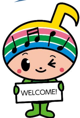
郡山市イメージキャラクター がくとくん

郡山市内の企業（官公庁含む）で 3日以上 のインターンシップに参加 する場合の交通費と宿泊費です。