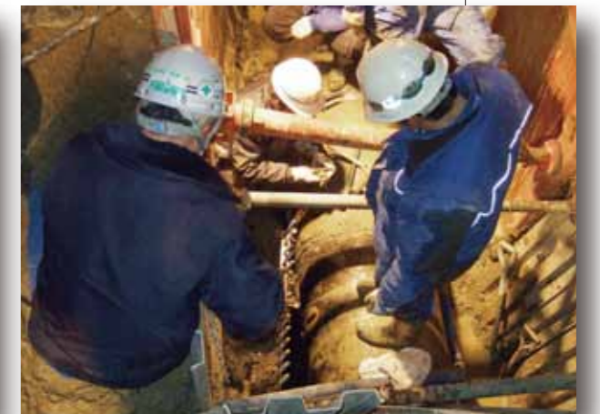
豊田浄水場内配管修繕

簡易水道においても、4施設で断水及び漏水が発生したため、その復旧作業を行いました。